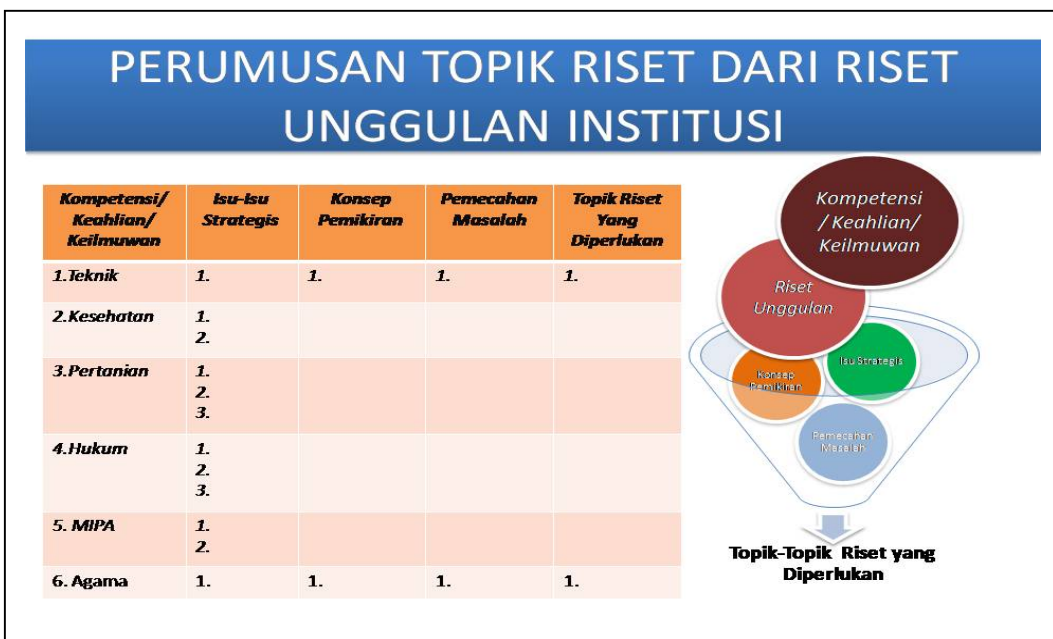
Gambar 3. Bagan Pengisian Topik dan Penelitian Unggulan.