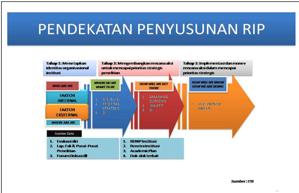
Gambar 2. Bagan Penyusunan RIP.